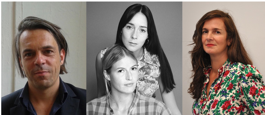
Table ronde - Photographier aujourd'hui