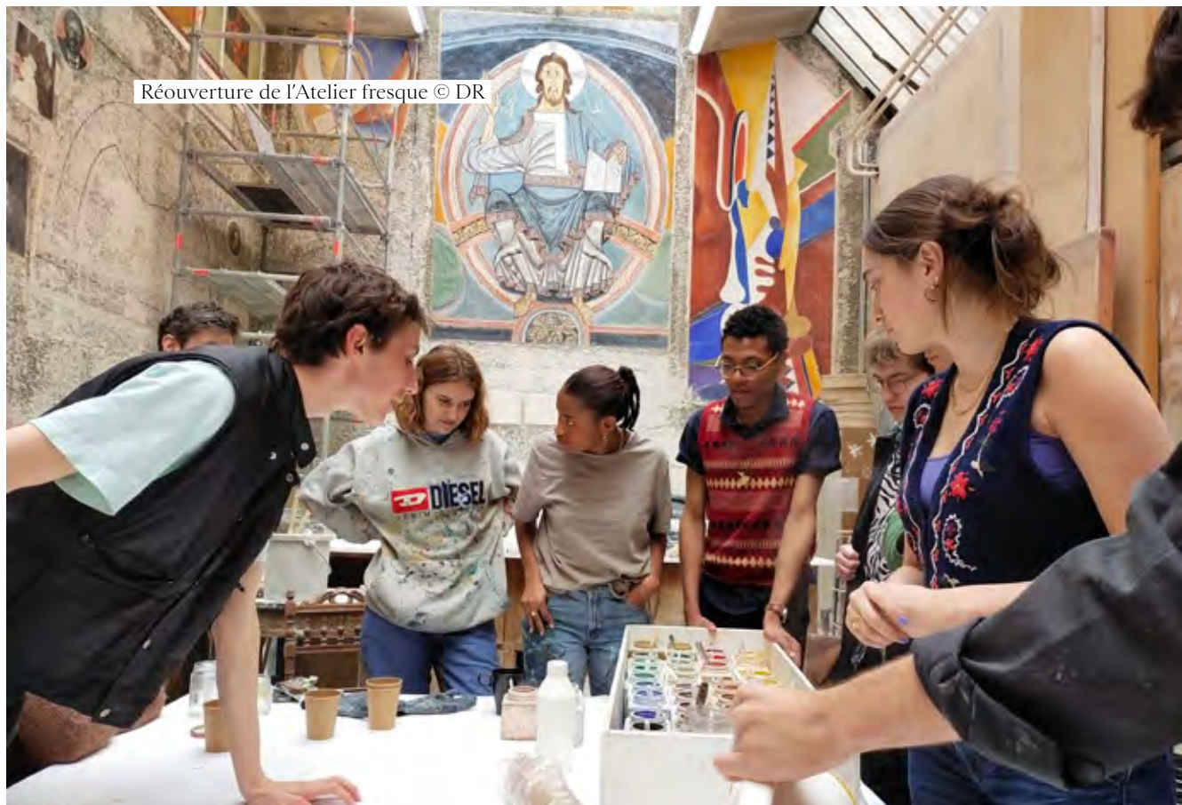
Réouverture de l'Atelier fresque

à candidature de la filière a été lancé en mai 2022 et a permis de sélectionner 13 étudiants pour la rentrée 2022/2023, parmi lesquels 2 diplômés 2022.