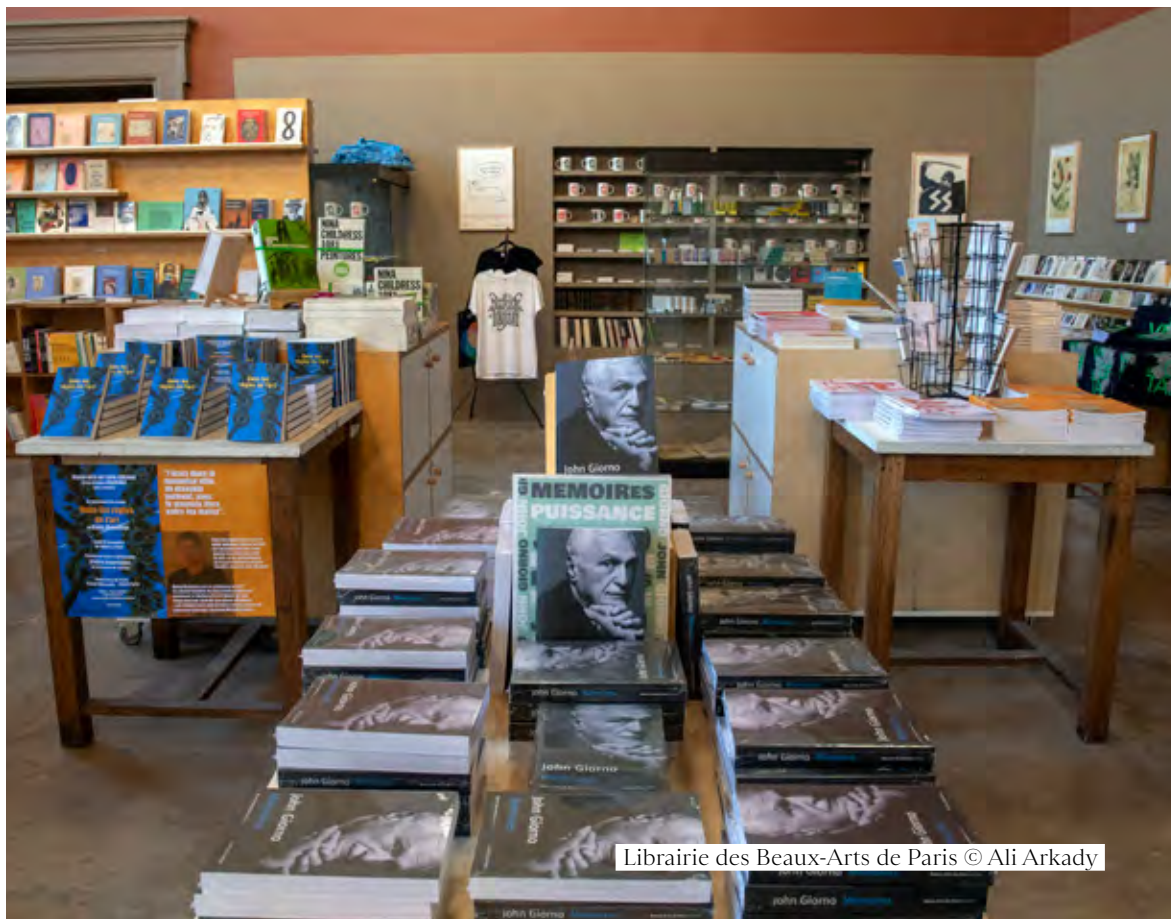
Librairie des Beaux-Arts de Paris

L'activité du département des Œuvres et de l'association des Amateurs du Cabinet des dessins a également été mise en avant par la publication du deuxième volume du catalogue Le Partage d'une passion pour le dessin .