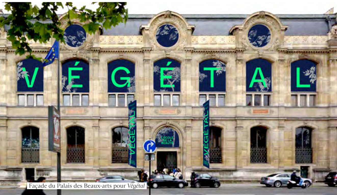
Façade du Palais des Beaux-arts pour Végétal

L'exposition présentait un état de la peinture contemporaine au travers des 33 artistes français et étrangers sélectionnés ces 10 dernières années par le Prix Jean-François Prat, dans une scénographie spécifiquement réalisée à cette occasion. Avec le soutien du Fonds de dotation Bredin Prat pour l'art contemporain.