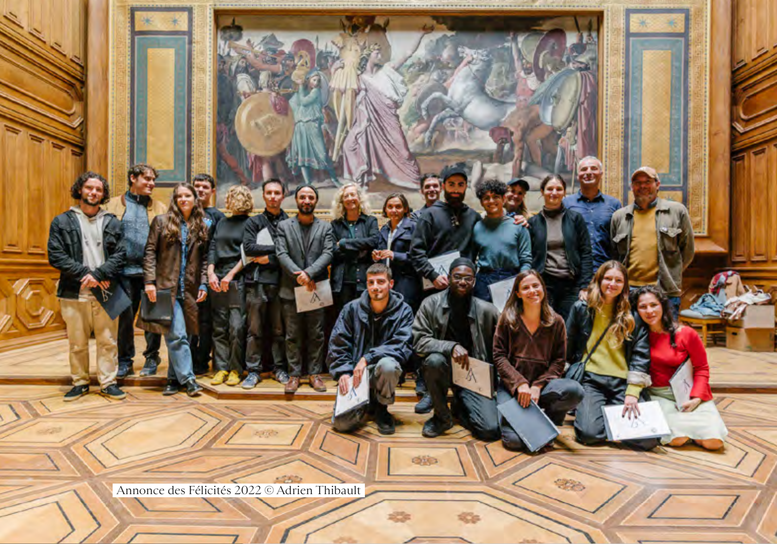
Annonce des Félicités 2022 © Adrien Thibault