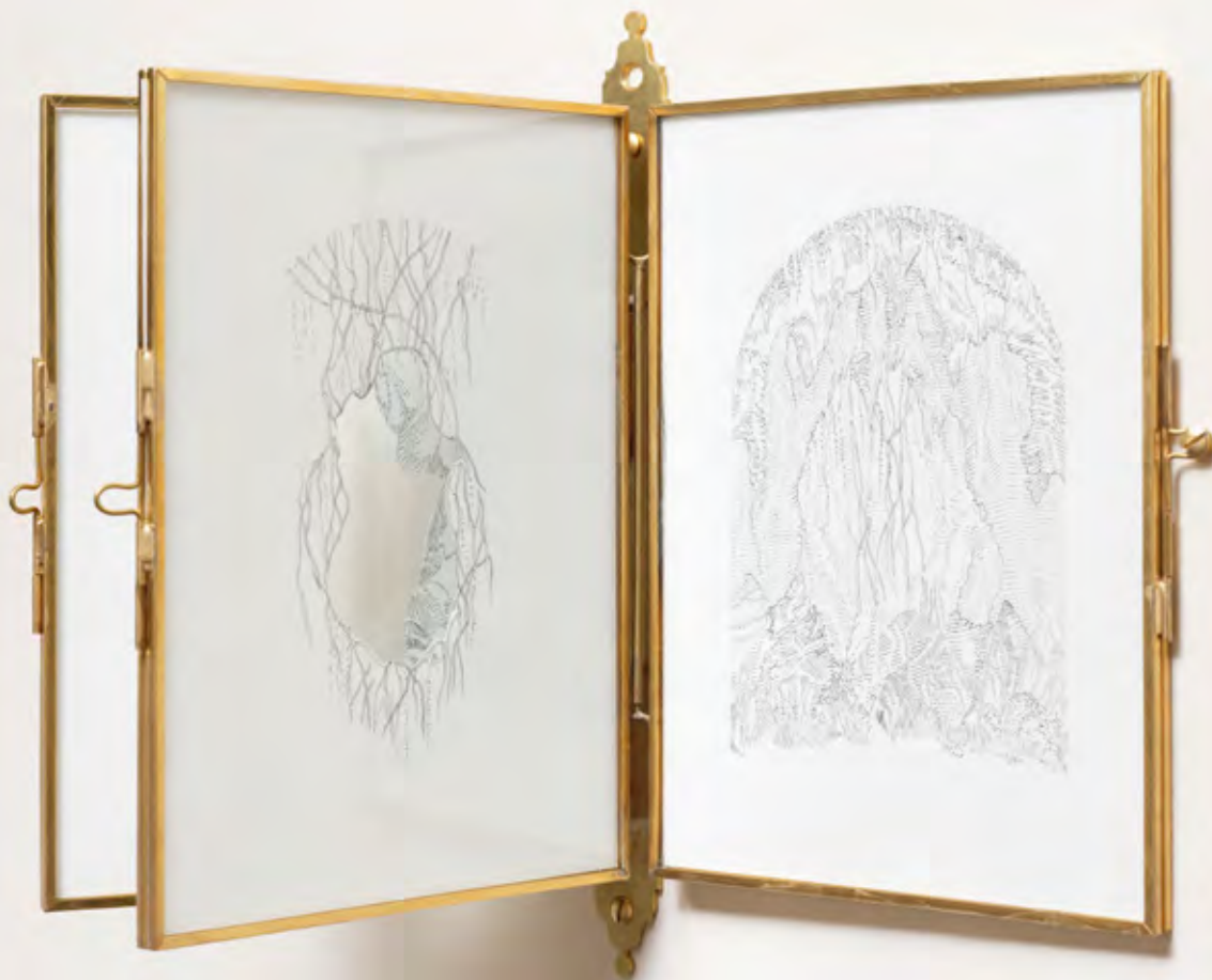
Vue de Eva Jospin, dessins pour un jardin