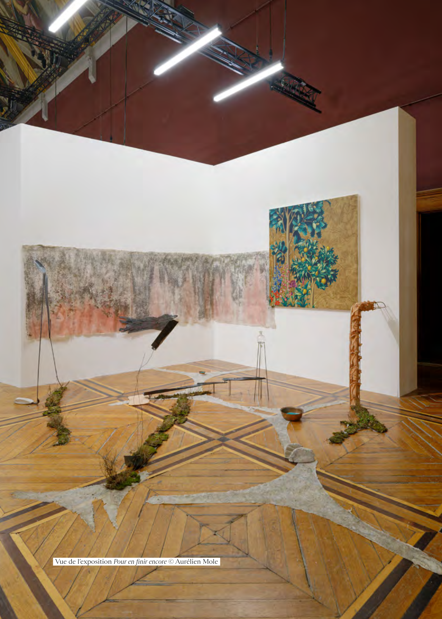
Vue de l'exposition Pour en finir encore