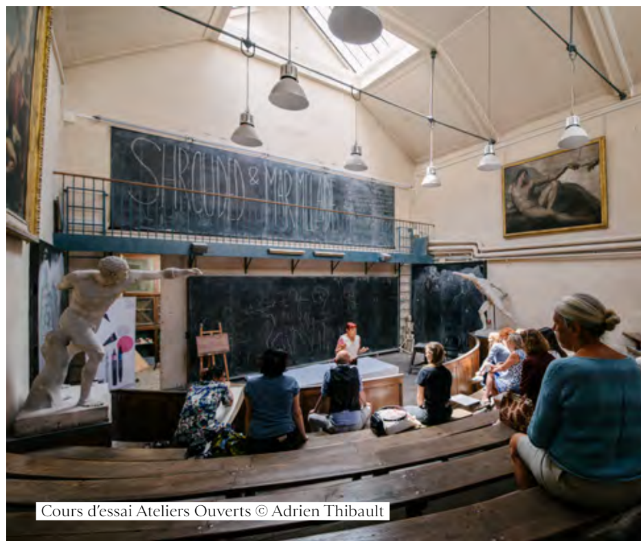
Cours d'essai Ateliers Ouverts

La NABA s'est dotée en 2022 d'un nouvel outil de e-commerce, développé par le Service de la Communication, du mécénat et des partenariats. Indépendant du site internet de l'École, ce nouvel outil au design ergonomique et adapté au smartphone facilite l'accès à l'offre, sécurise le paiement en ligne et simplifie la procédure d'inscriptions pour les participants. Pour accompagner cette simplification, la grille tarifaire a été actualisée au printemps 2022 permettant une meilleure lisibilité de l'offre.