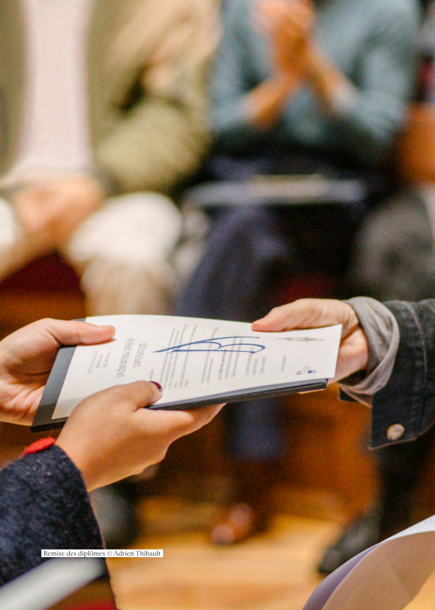
Remise des diplômes