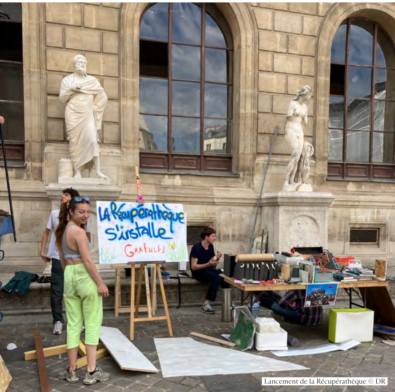
Lancement de la Récupérathèque

Initié à l'été 2022, un partenariat avec « Mondes Nouveaux » a permis de mettre en place une série de workshops autour de l'artiste et designer Olivier Vadrot, pour dessiner une scénographie adaptable et réutilisable à partir de matériaux durables et recyclables. Cette scénographie sera utilisée a minima pour l'ensemble des expositions 2023/2024.