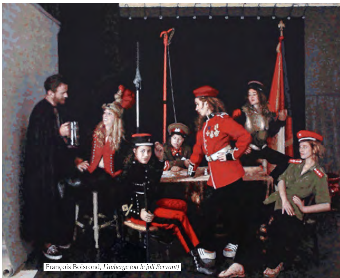
François Boisrond, L'auberge (ou le joli Servant)