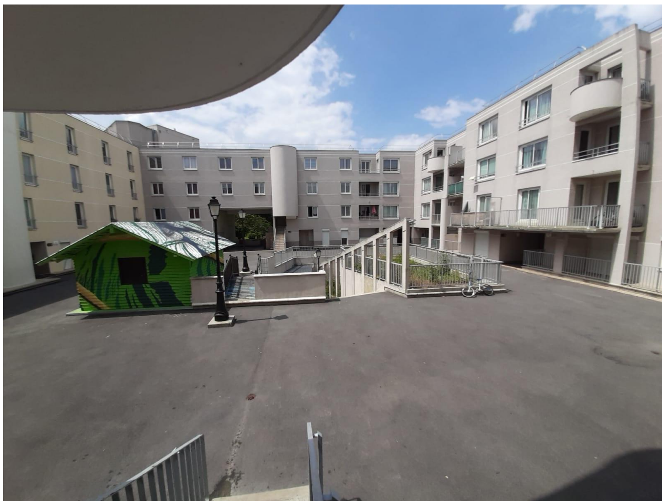
Local vélo habillé par l'artiste Daniel Nicolaevsky-Maria, diplômé 2019 des Beaux-Arts de Paris