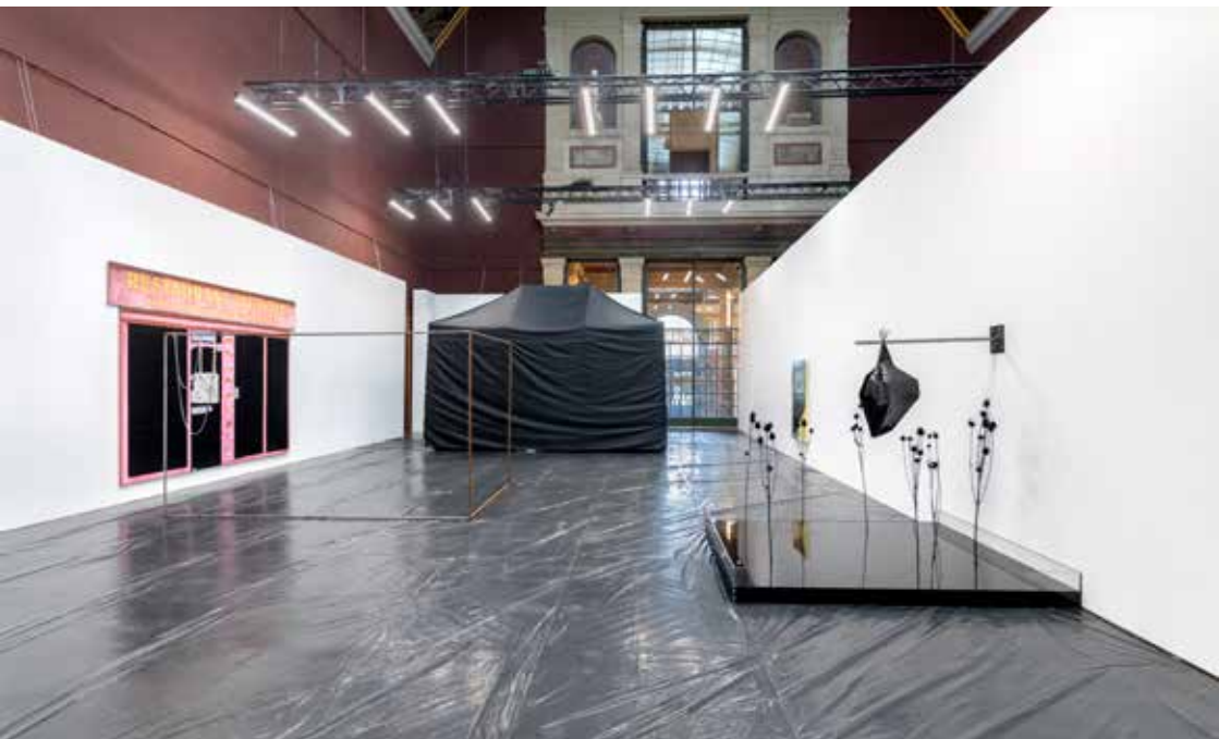
Vue de l'exposition Pendant que d'autres écrasent des nuits encore moites . Commissaire : Juliette Hage