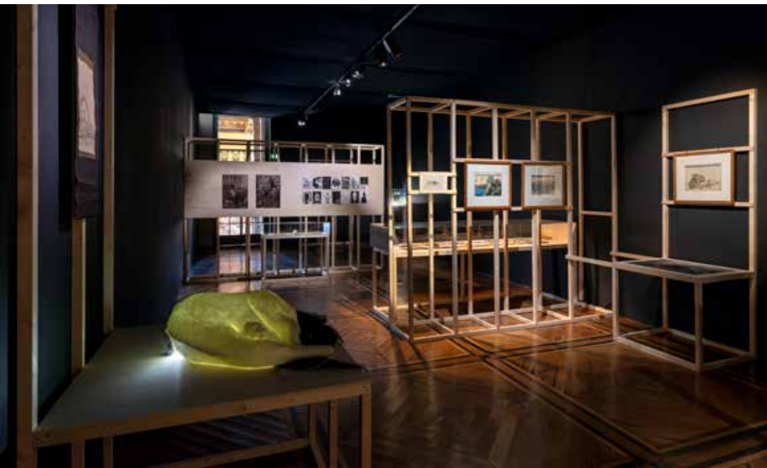
Vue de l'exposition Répliques Japonisme . Commissaires : Anne-Marie Garcia, Alice Narcy et Clélia Zernik