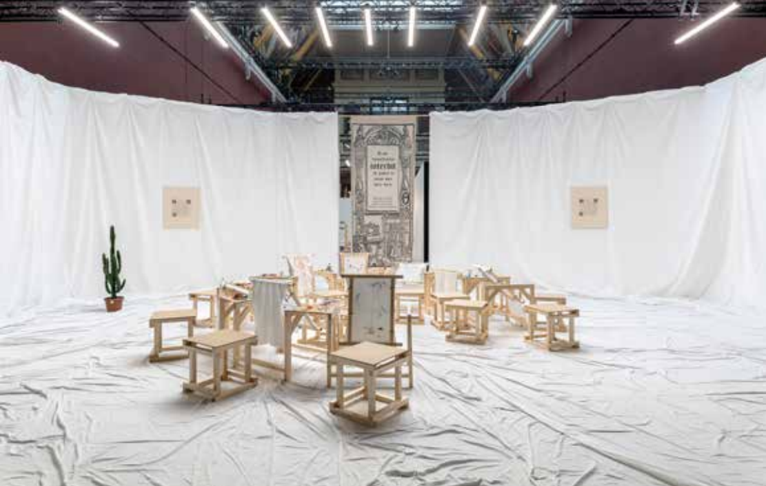
Vue de l'exposition Points . Commissaires : Paul-Émile Bertonèche, Andreas Février

Projets hors-les-murs : des projets hors-les-murs peuvent être proposés (précédents partenariats : Palais de Tokyo, Frac Ile-de-France, Musée Eugène Delacroix, Théâtre du Châtelet, Fondation Pernod Ricard, Centre des Monuments Nationaux...).