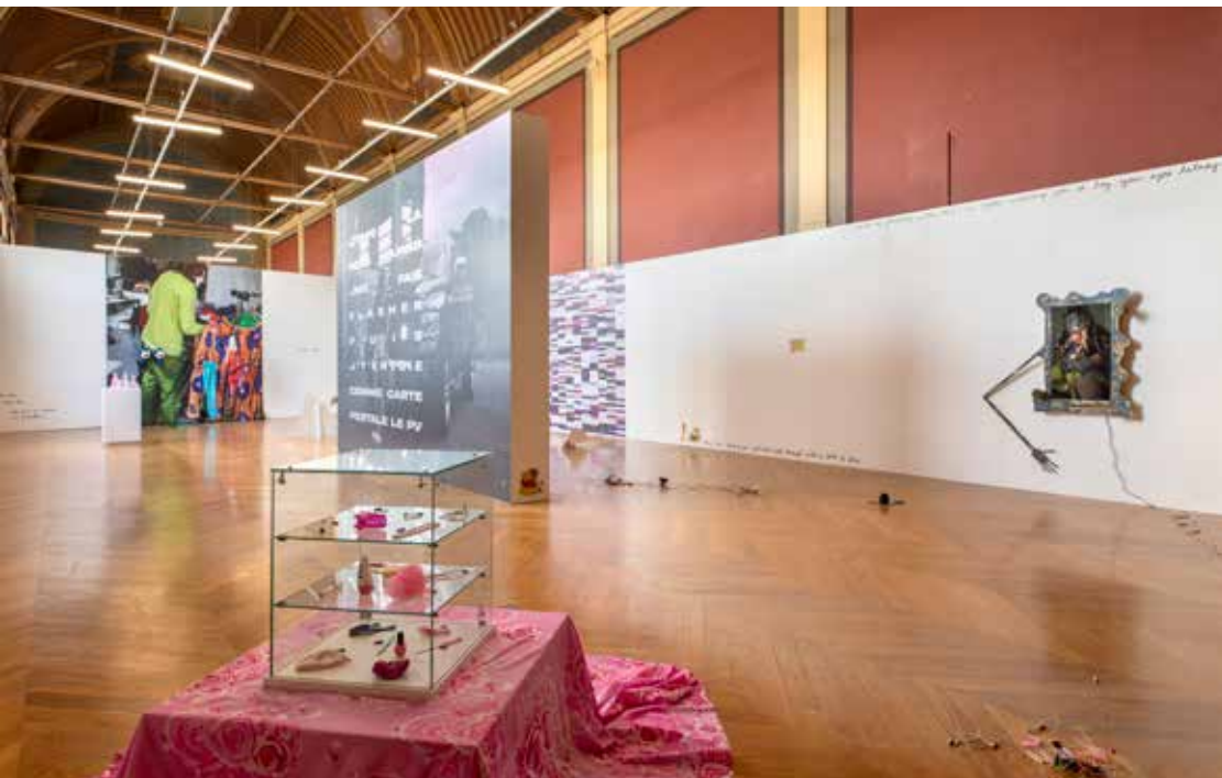
Vue de l'exposition Teen Spirit . Commissaire : Céline Furet