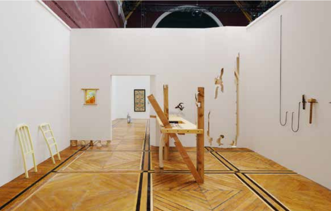
Vue de l'exposition Le métier de vivre . Commissaire : Raphaël Giannesini

La Résidence est associée à la filière « Artistes & Métiers de l'exposition » regroupant une quinzaine d'étudiants des Beaux-Arts de Paris.