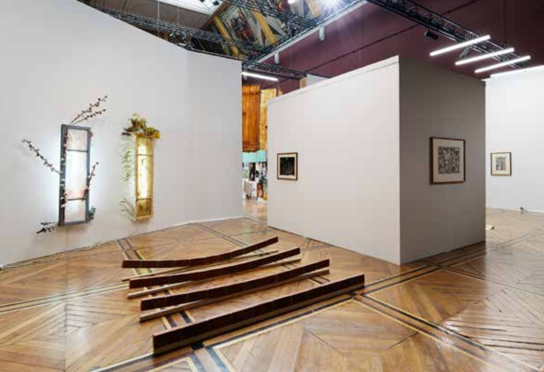
Vue de l'exposition Mais pour me parcourir enlève tes souliers . Commissaire : Violette Morisseau.