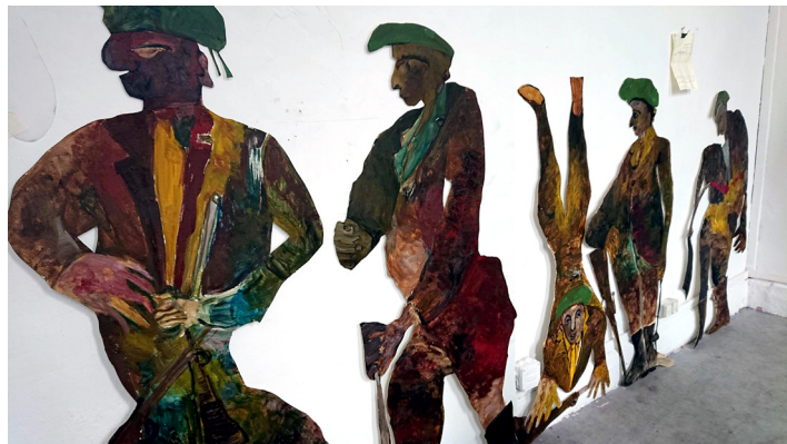
Vue de l'atelier d'Anna Boghiguan aux Beaux-Arts de Paris, 2019