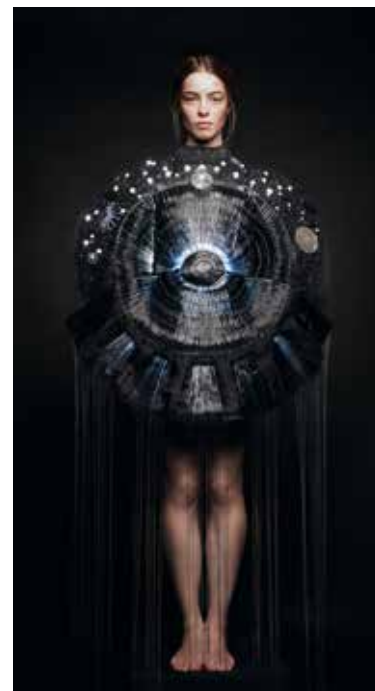
© MARIE-AMÉLIE TONDU & ALEXIS SENAFFE