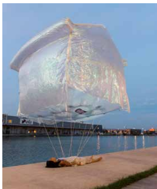
Ma maison en l'air , Jisoo Yoo, 2018. Courtesy de Jisoo Yoo, ENSAPC