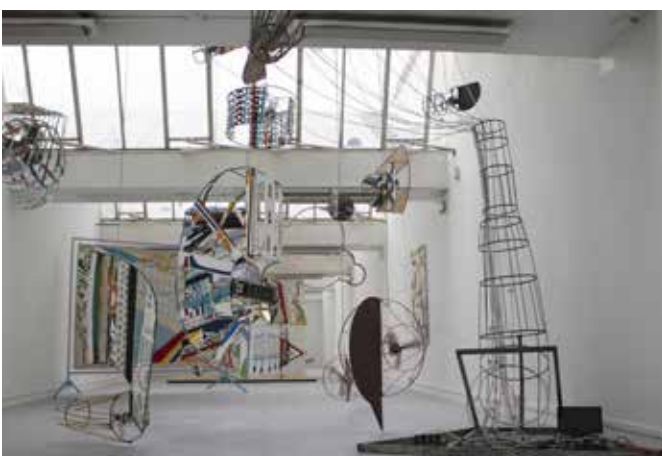
Aérrissage , Victor Cord'homme, ENSBA