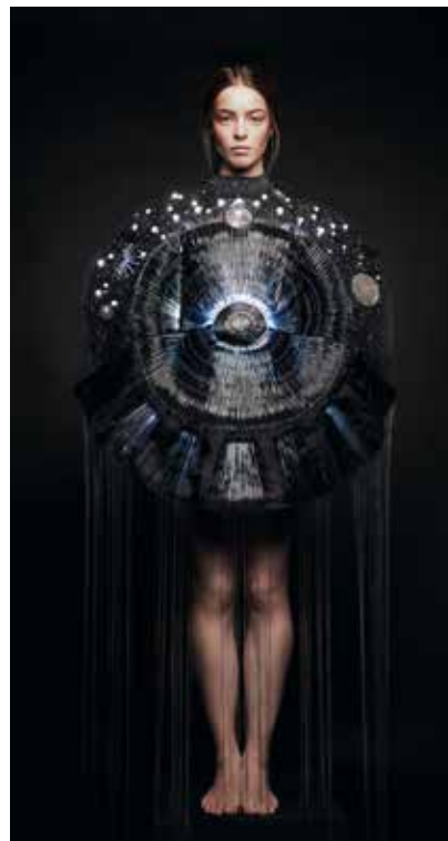
© MARIE-AMÉLIE TONDU & ALEXIS SENAFFE