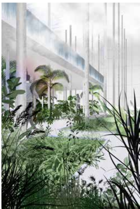
Sexcloud - Meet at the airport , 2016. Fanchon Bonnefois & Camille Demouge, diplômé ENSAD 2016 secteur architecture intérieure