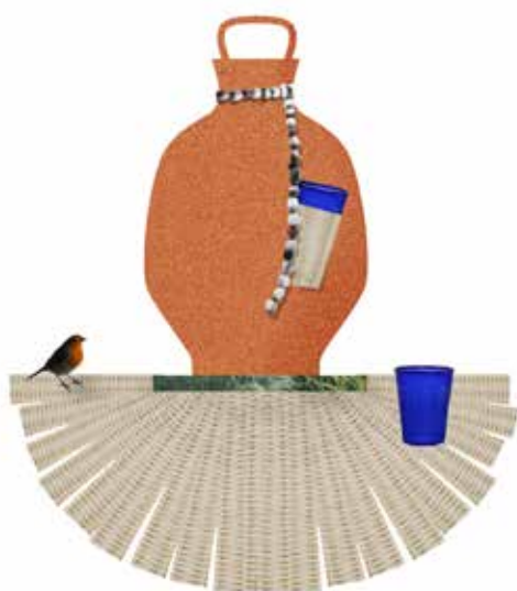
Manman Dlo , Collage, 2018. dach&zephir, diplômés ENSAD 2016 secteur design objet