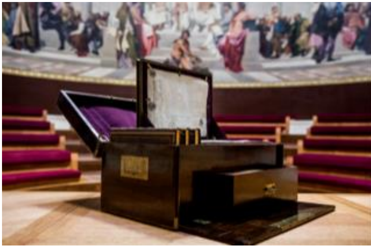
Le coffre- reliquaire d'Héloïse et Abélard

Le groupe Kering a financé en 2018 l'acquisition d'un objet d'intérêt patrimonial majeur, le Reliquaire d'Héloïse et Abélard constitué par Alexandre Lenoir, confortant ainsi l'enrichissement d'une collection de 450 000 œuvres ayant reçu le label « Musée de France » le 10.07.17.