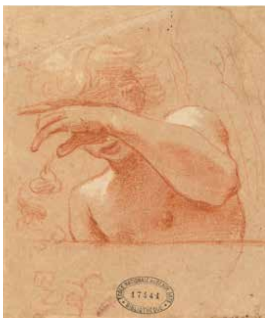
Ludovico Carrache, Étude d'ange à mi-corps, la main devant les yeux